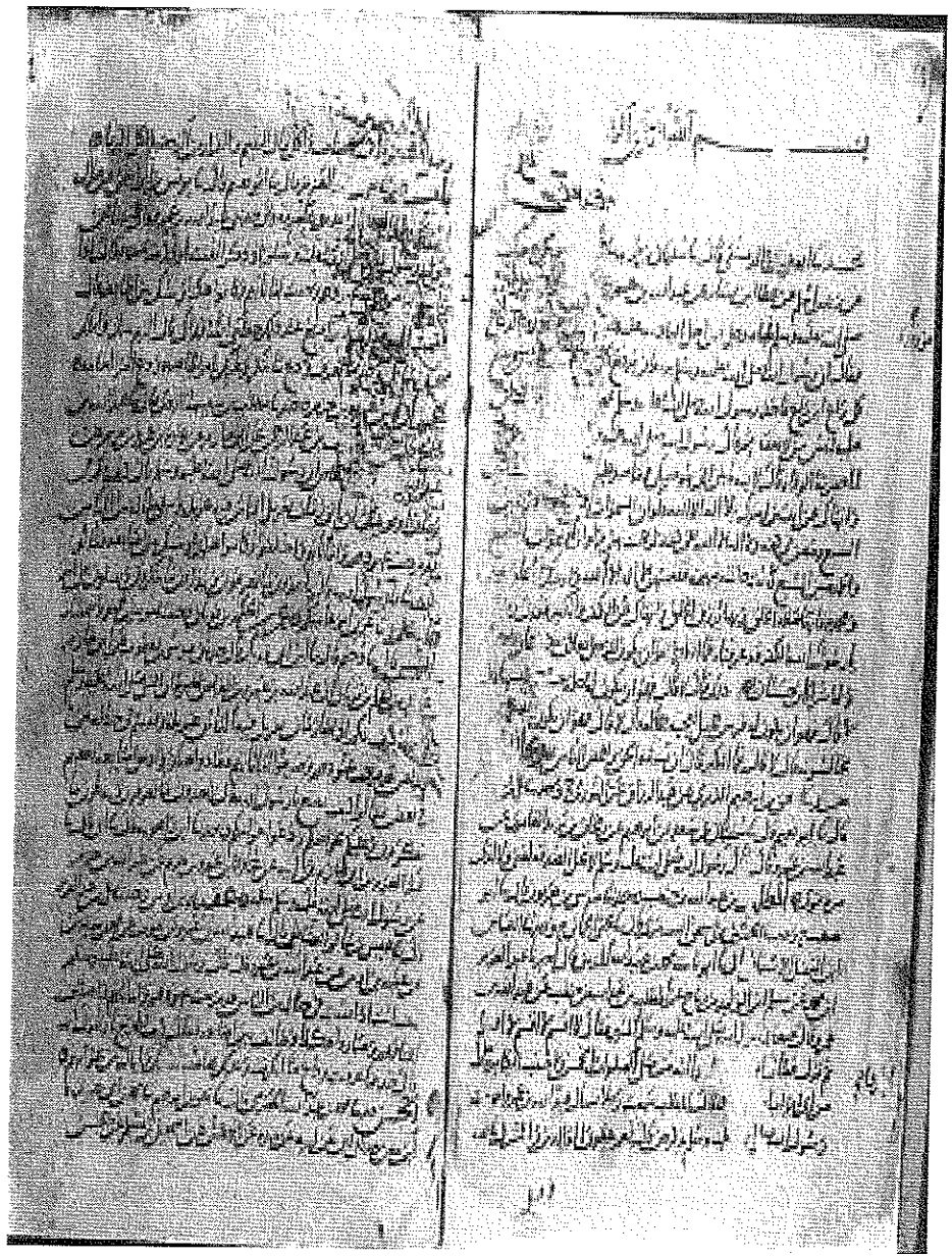
بداية المجلد، ويبدأ فيه الجزء الأخير من مسند عبدالله بن عمرو بن العاص