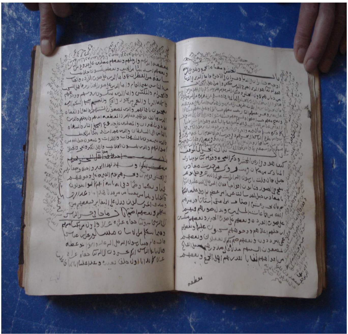
الصفحة [ب/ ٤٦]، [أ/ ٤٧] من المخطوط بخط المؤلف.