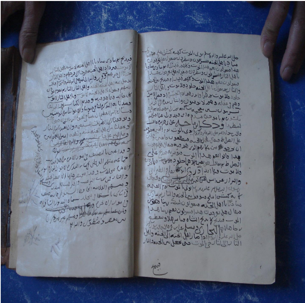
الصفحة [ب/ ٩٢]، [أ/ ٩٣] من المخطوط بخط المؤلف ويظهر فيها خاتمة الكتاب.